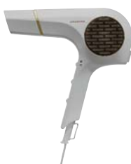
WG:ホワイトゴールド